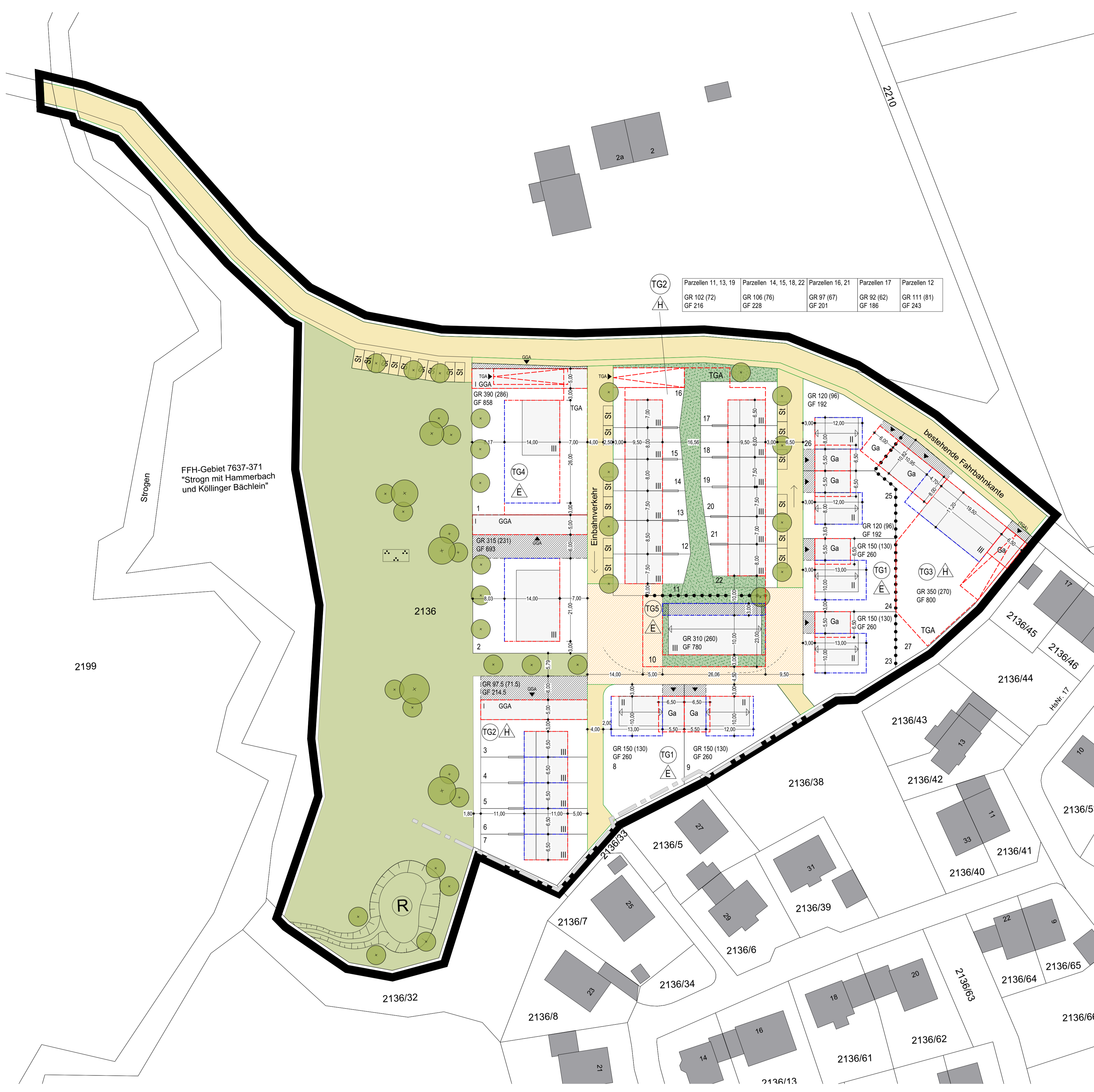
LAGEPLAN M 1:500