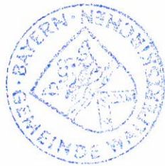
Hörmann 1. Bürgermeister